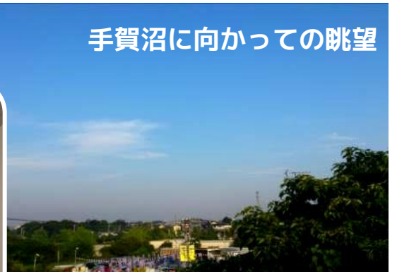
手賀沼に向かった眺望