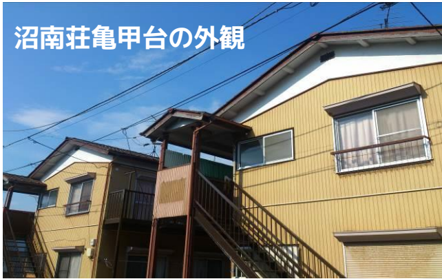
沼南荘亀甲台の外観