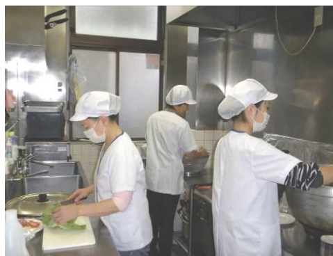
作業場・厨房・作業風景