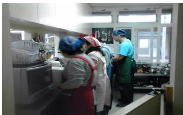
メンバーによる昼食づくり