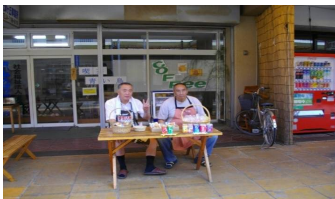
ある日の店頭販売、作りたてのクッキーを中心