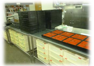
作業場・厨房・作業風景